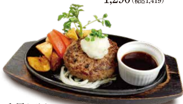
和風おろし ハンバーグステーキ [180g]