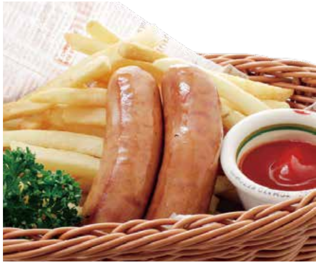
ソーセージ&ポテトフライ 740 (税込814)