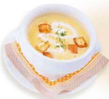
定番!人気メニュー つぶつぶコーンスープ