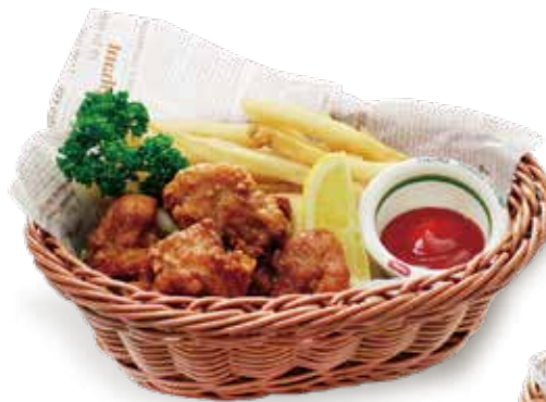
から揚げ&ポテトフライ