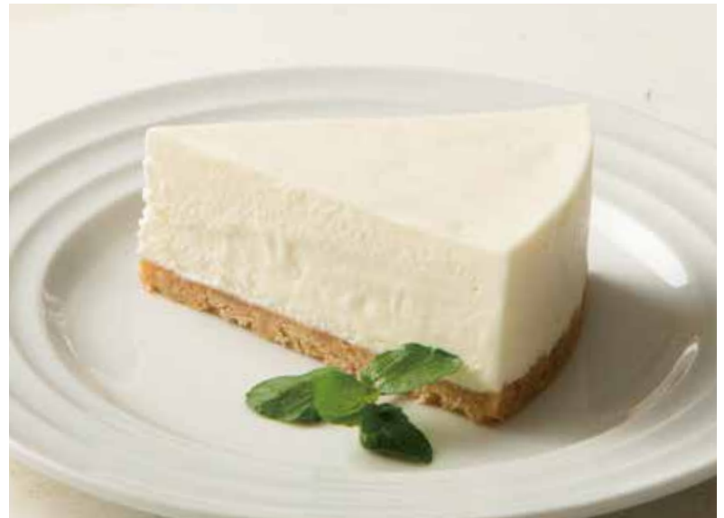
レアチーズケーキ