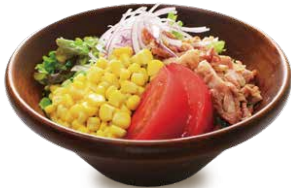
トレイルグリーンサラダ オニオンドレッシング