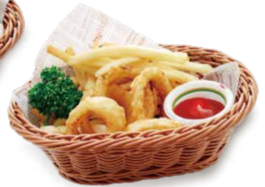
オニオンリングフライ &ポテトフライ