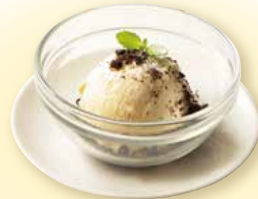
バニラアイス 150(税込165)