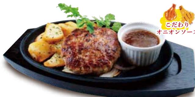
ハンバーグステーキ 自家製オニオンソース [180g]