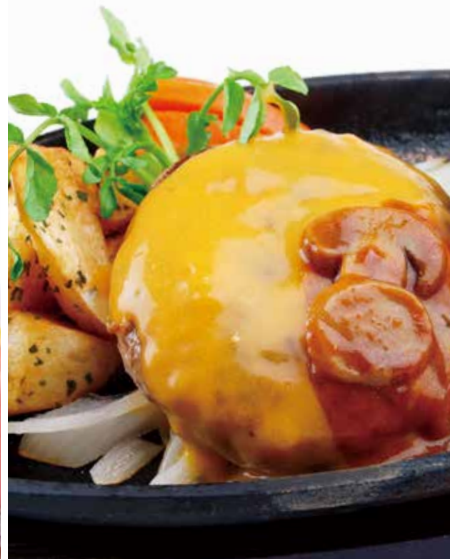
チェダーチーズハンバーグステーキ デミグラスソース [180g]

ハンバーグステーキにデミグラスソースと とろ〜りチェダーチーズをかけた人気の一品です。