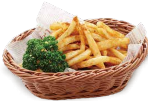
スパイシーポテトフライ