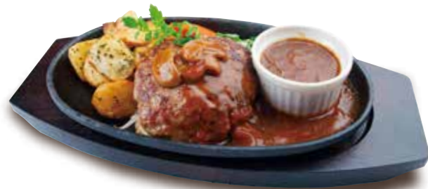
ハンバーグステーキ デミグラスソース [180g]