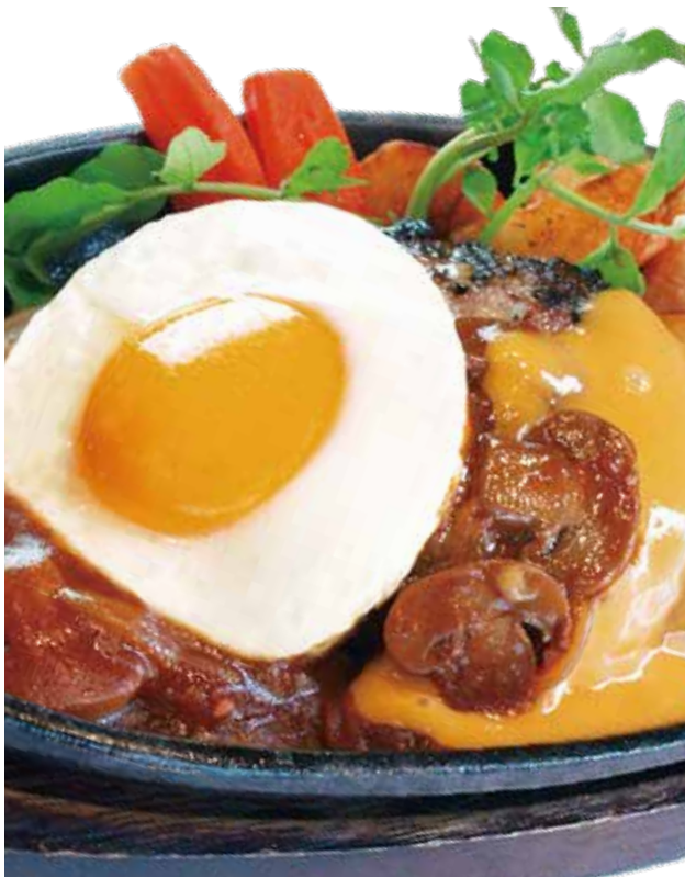
目玉焼きハンバーグステーキ チェダーチーズ [180g]

デミグラスソースとチェダーチーズをかけ、 さらに目玉焼きをのせた豪華なハンバーグステーキ!