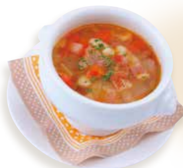
具沢山のスープ 野菜たっぷりコンソメスープ