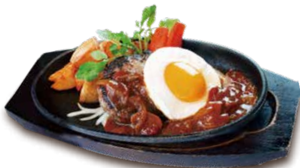
目玉焼きハンバーグステーキ たっぷりデミグラスソース [180g]